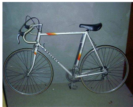
3. Constructeur automobile français qui fabrique aussi des deux roues.