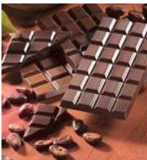
9. Marque belge, créée par un maître chocolatier, Charles Neuhaus, le 24 avril 1883.