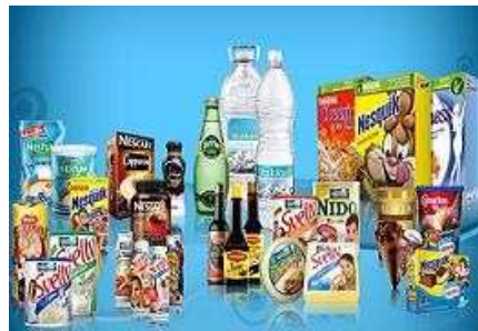
7. Multinationale suisse, la plus grande société agroalimentaire mondiale fondée en 1866 par un pharmacien suisse.