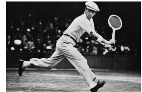
5. Marque de vêtements créée par un joueur de tennis de 1933 et qui porte son nom.