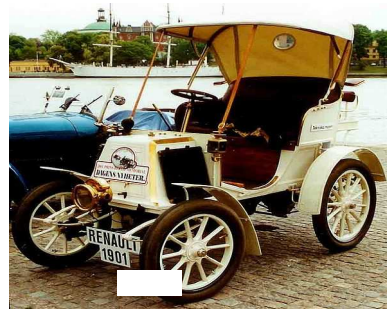
2. Constructeur automobile français qui utilise la course automobile pour la promotion de ses produits.