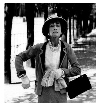
20. Maison de haute couture française dont la créatrice a introduit le pantalon pour femmes dans ses défilés.