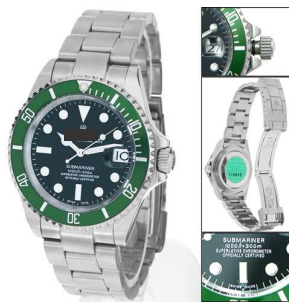
15. Marque suisse de montres de luxe dont le modèle phare est la Oyster.