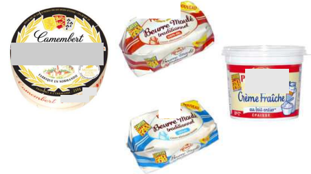
14. Marque de fromage français du groupe Lactalis, créée par André Besnier en 1968.