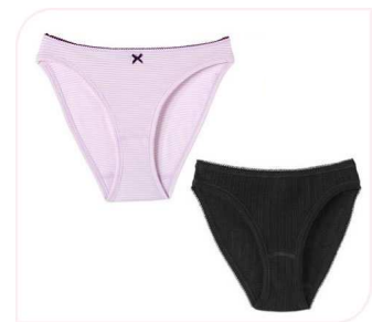
8. Marque spécialisée dans les sous-vêtements créée à Troyes en 1920 rachetée par Yves Rocher en 1988.