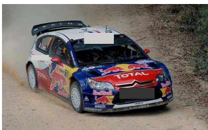
18. Constructeur automobile français, six fois vainqueur du championnat du monde de rallye grâce à Sébastien Loeb.