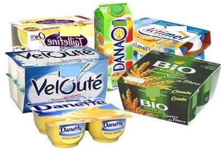
1. Groupe agroalimentaire français qui produit et commercialise des produits laitiers et de l'eau principalement.