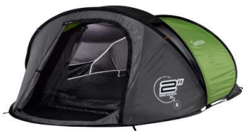
6. Marque qui a inventé la tente qui se déplie en deux secondes.