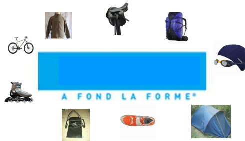
4. Chaîne commerciale de sports qui a comme slogan "A fond la forme!"