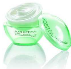
10. Le créateur de cette marque de cosmétiques qui porte son nom est un breton, maire de La Gacilly, son village natal, de 1962 à 2008.