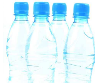
13. Marque d'eau minérale dont la source se situe dans une ville française de Haute-Savoie sur les bords du lac Léman jumelée avec la ville espagnole de Benicasim.