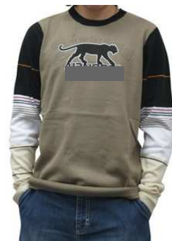
17. Equipementier de l'équipe nationale de football du Mali, pays d'origine du créateur de la marque.