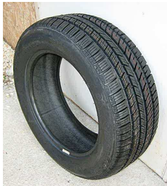
12. Fabricant français de pneumatiques, inventeur du pneu démontable pour vélo en 1891.