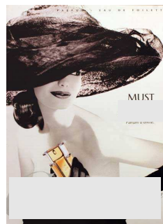
16. Entreprise française de luxe (joaillerie et horlogerie), créée à Paris en 1847, mondialement connue pour ses montres.