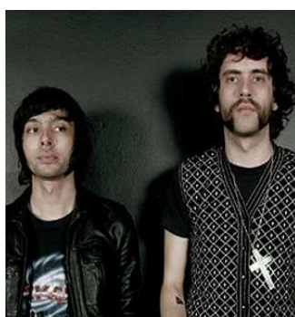
18 Nous sommes un duo de musiciens parisiens. Notre musique est électronique.