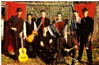
7 Groupe de rock alternatif. Leur musique est plutôt guinguette.