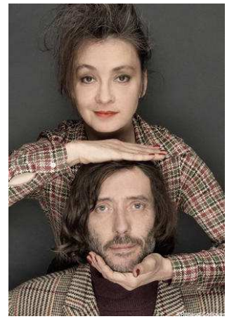
3 C'est un duo pop-rock français des années 80.