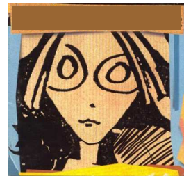
9 Groupe de rock bordelais. J'obtiens plusieurs fois les Victoires de la Musique