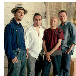
16 Groupe qui fait de la musique accoustique avec une forte influence reggae.