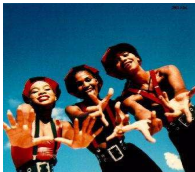
12 Je suis un groupe entièrement féminin originaire de la Guadeloupe.