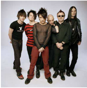
1 Groupe du courant new-wave qui a connu un énorme succès avec J'ai demandé à la lune .