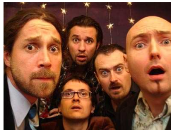
8 Groupe qui mêle l'humour et les genres musicaux. Ils représentent la France à l'Eurovision.