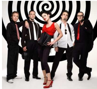
5 Groupe de power-pop âgée de 10 ans. Mon nom est un moyen de transport.