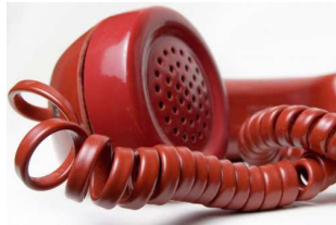
2 Groupe de rock français formé en 1976 par Jean-Louis Aubert.