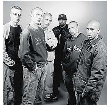
6 C'est un groupe de rap marseillais. Mon chanteur Akhenaton a choisi mon nom qui est un sigle.