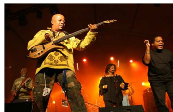
19 Nous sommes guadeloupéens et martiniquais. Notre nom signifie galette de manioc en créole