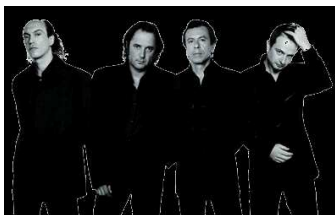
11 Quatuors qui chante a capella et qui s'inspire du doo-wop.