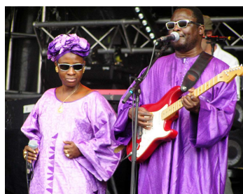
14 Nous sommes un couple de chanteurs et musiciens maliens. Nous sommes tous les deux aveugles.