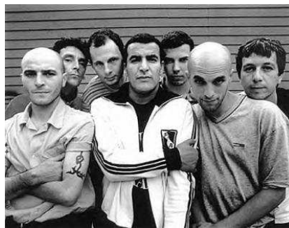
10 Mon nom est beurre en arabe. Je suis un groupe toulousain.