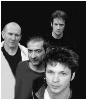
4 C'est un groupe qui milite contre la mondialisation et le fascisme.