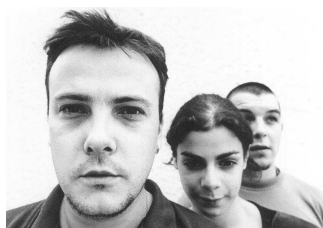
15 Nous sommes stéphanois. Notre succès arrive en 2000 avec notre tube écologiste Respire