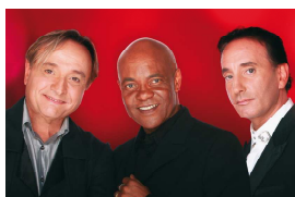
20 Groupe toulousain qui enflamme les pistes de danse en 1999 avec Les démons de Minuit