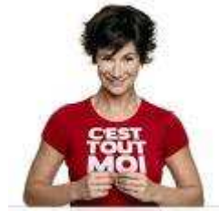
16 Je suis humoriste et comédienne belge. Mon Premier spectacle s'appelle : Dis oui!