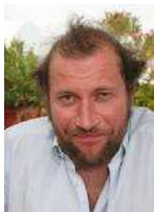
20 Comique et acteur belge, je suis populaire en Belgique francophone pour mes caméras cachées.