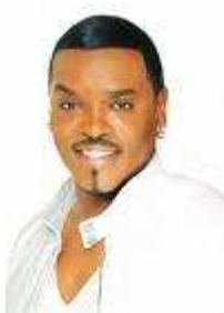
15 Je suis humoriste, acteur et chanteur canadien.