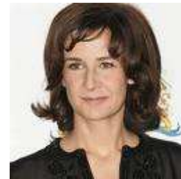
9 Actrice, réalisatrice, scénariste, chanteuse et Comique sont mes métiers. Actuellement, je suis la mère du „Petit Nicolas“.