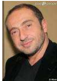
18 Je suis humoriste, acteur et réalisateur français d'origine algérienne.