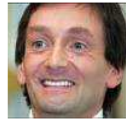
6 Comique bordelais, je forme un duo comique avec Michèle Laroque.