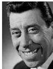
5 Comique d'après-guerre, on l'appelle gueule de cheval. Il donne vie à Don Camillo.