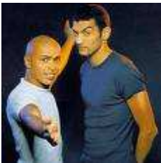
17 Nous sommes un duo de comiques français mais aussi acteurs dans la Tour Montparnasse infernale.