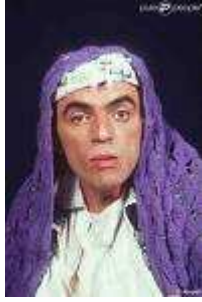
12 Je suis humoriste et acteur français d'origine tunisienne. J'adore être Madame Safarti.