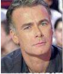
14 Humoriste et acteur français né en Normandie. Je suis macho et maladroit.