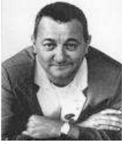
1 Je suis drôle mais j'ai un grand coeur pour aider les autres