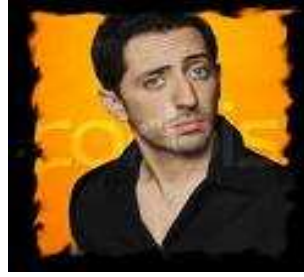
2 Je suis humoriste marocain et canadien. J'ai un frère réalisateur. J'ai une carrière de comédien.