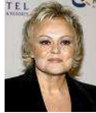
13 Je suis comédienne et humoriste française. Je me fait connaître dans l'émission „ La Classe“.