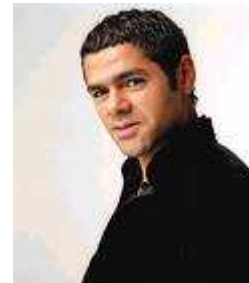
19 Je suis humoriste, acteur et réalisateur français d'origine marocaine. Je n'ai pas ma main droite.