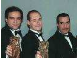
11 Ce trio comique est très populaire dans les années 90. Notre premier film s'appelle les Trois Frères.