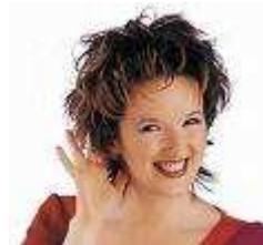
8 Je suis parisienne d'origine juive. 2007 est l'année de mes 20 ans de carrière. J'anime sur Europe1 une émission satirique