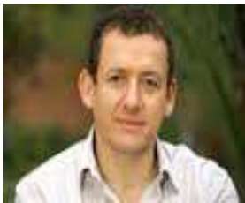
7 Je suis fier de mes origines du Nord. Je suis également comédien.