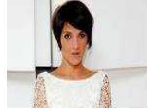
3 Jeune humoriste et comédienne lyonnaise. Elle vient d'être maman. Son nouveau spectacle raconte sa maternité.