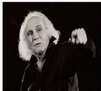
Léo Ferré en 1991, lors d'un concert de soutien à Radio libertaire.