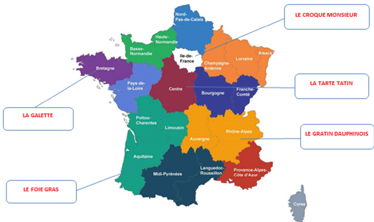
LE FOIE GRAS