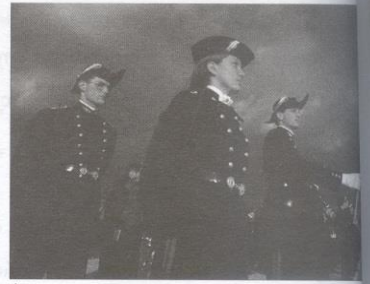
Élèves de Polytechnique