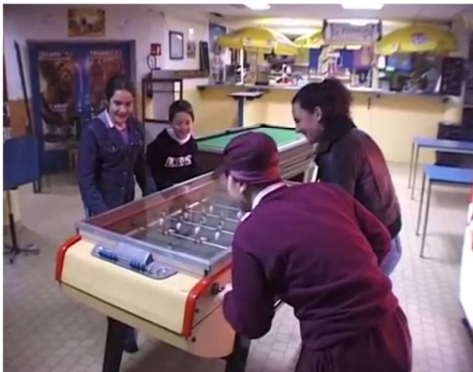
3- LA RÉCRÉ