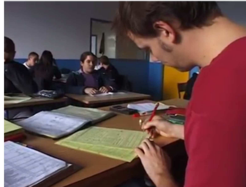
2- LA SALLE DE CLASSE