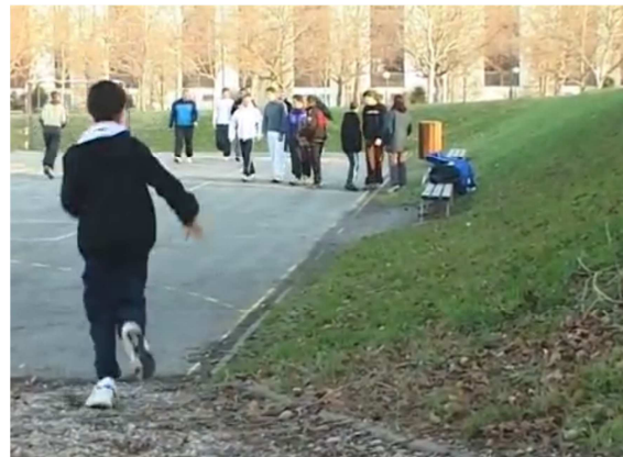
5-EPS (ÉDUCATION PHYSIQUE ET SPORT)