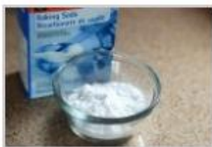
1 cuillerée à café de levure