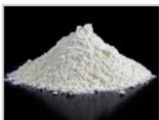
340 g de farine de riz (ou blé*)