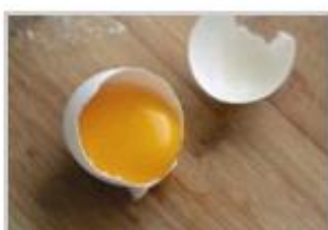
2 oeufs (1 seul si farine de blé*)