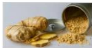
1 cuillerée à café de gingembre