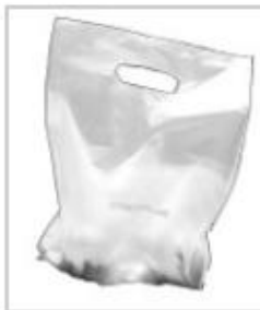
des sacs congélation