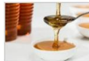
4 cuillerées à soupe de miel liquide