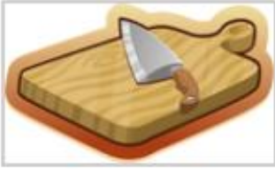
une planche à découper

Pour faire les biscuits il vous faudra le matériel suivant: