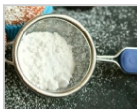
225 g de sucre glace