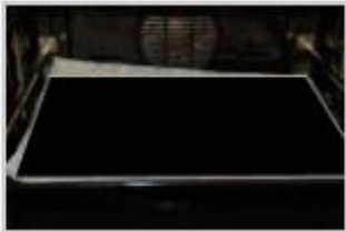
une plaque de cuisson