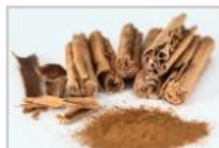
1 cuillerée à café de cannelle