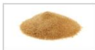
85 g de sucre