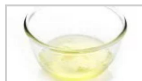
1 blanc d'oeuf