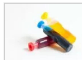
des colorants alimentaires