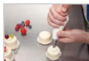
une poche à pâtisserie (ou des sacs congélation)