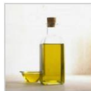
100 g d'huile (ou de beurre*)