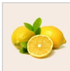
1 cuillerée à café de jus de citron