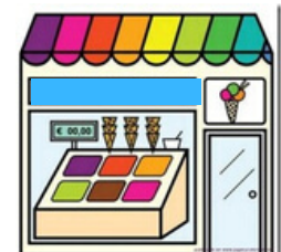
LE MARCHAND DE GLACES