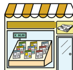
LE MARCHAND DE JOURNAUX