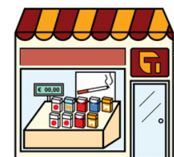
LE BUREAU DE TABAC