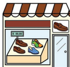
LE MAGASIN DE CHAUSSURES