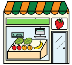
LE MARCHAND DE PRIMEURS