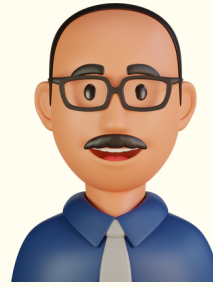
EMPLOYÉ(E) DE BUREAU