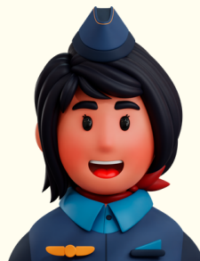
HÔTESSE / STEWARD