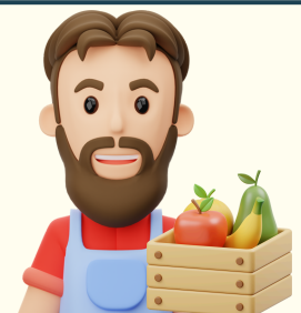
MARCHAND(E) DE FRUITS