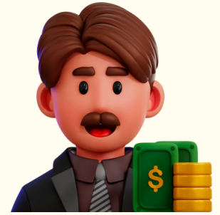
EMPLOYÉ(E) DE BANQUE