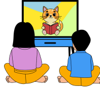
Regarder la télé