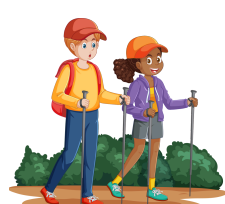
Faire une excursion