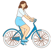
Faire du vélo