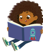
Lire un livre