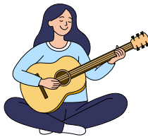
Jouer de la guitare