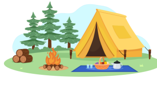
Faire du camping