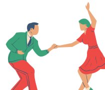
La danse Danser