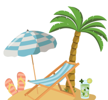
Aller à la plage