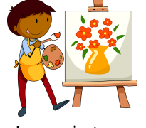
La peinture Peindre