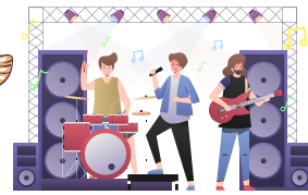
Aller à un concert