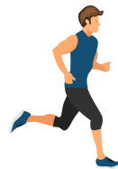
Le jogging - Courir