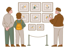
Aller au musée