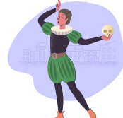
Aller au théâtre