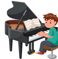
Jouer du piano