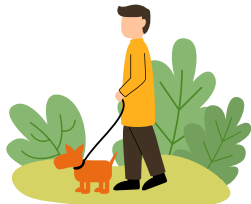
Aller à la campagne