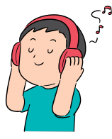
Écouter de la musique