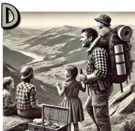
EXTRAIT N° _____