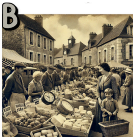
EXTRAIT N° _____