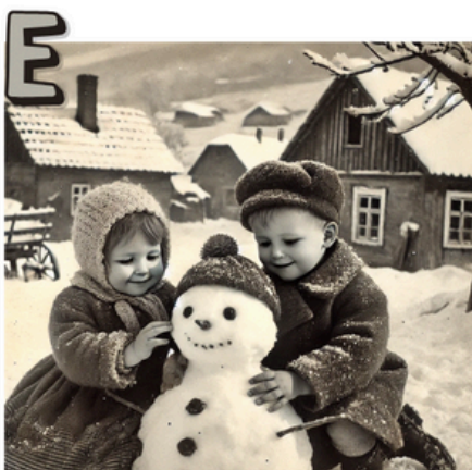
EXTRAIT N° _____