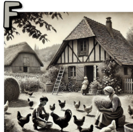
EXTRAIT N° _____