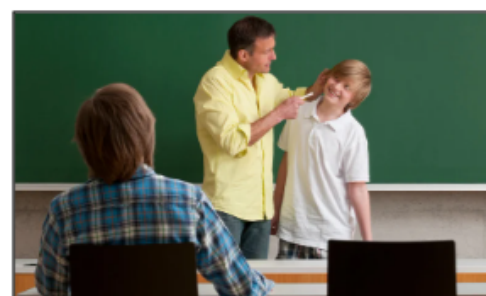
Tirer des oreilles