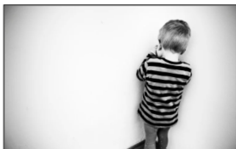
Envoyer au coin / au piquet