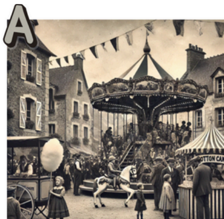
EXTRAIT N° _____

1. Regardez maintenant l'album photo des souvenirs de l'enfance de Raphaël. Écoutez les six extraits et associez-les à l'image correspondante.