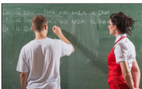
Copier des lignes