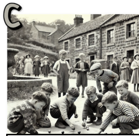
EXTRAIT N° _____