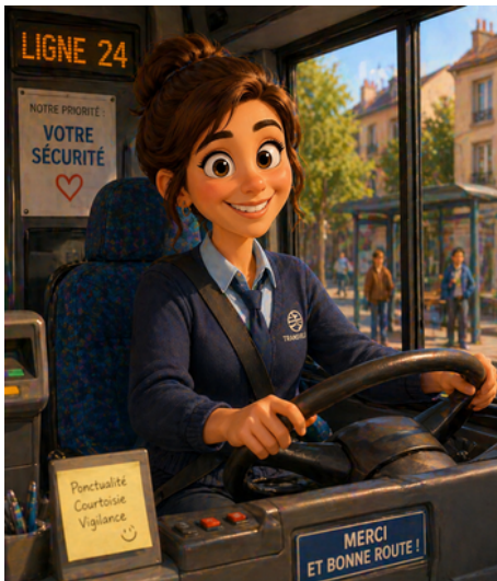
CONDUCTRICE DE BUS