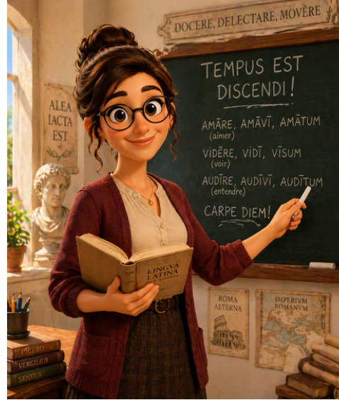
PROFESSEURE DE LATIN