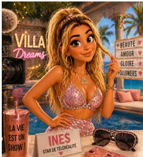
STAR DE TÉLÉRÉALITÉ